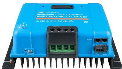
SmartSolar-Lade-Regler MPPT 150/100-Tr VE.CAN ohne Display