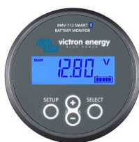
Bluetooth-Sensorkit: BMV-712 Smart Batteriewächter